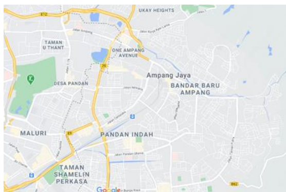
Rajah 1: Peta Kawasan Ampang, Selangor

Masyarakat Ampang juga masyarakat yang berfikiran terbuka dan sedia membantu para pelajar yang ingin melaksanakan kajian seperti ini. Selain itu, Ampang juga meliputi masyarakat yang melaksanakan pelbagai jenis pekerjaan seperti perniagaan sendiri, kerani, guru dan banyak lagi. Oleh itu, Ampang merupakan lokasi yang mempunyai kepelbagaian jenis masyarakat. Oleh hal yang demikian, Ampang merupakan lokasi yang strategik untuk melaksanakan kajian ini.