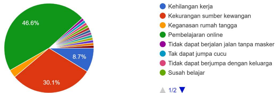
Rajah 3: Punca Responden Mengalami Masalah Kesihatan Mental

Punca berasa tertekan semasa pandemik Covid-19 103 responses