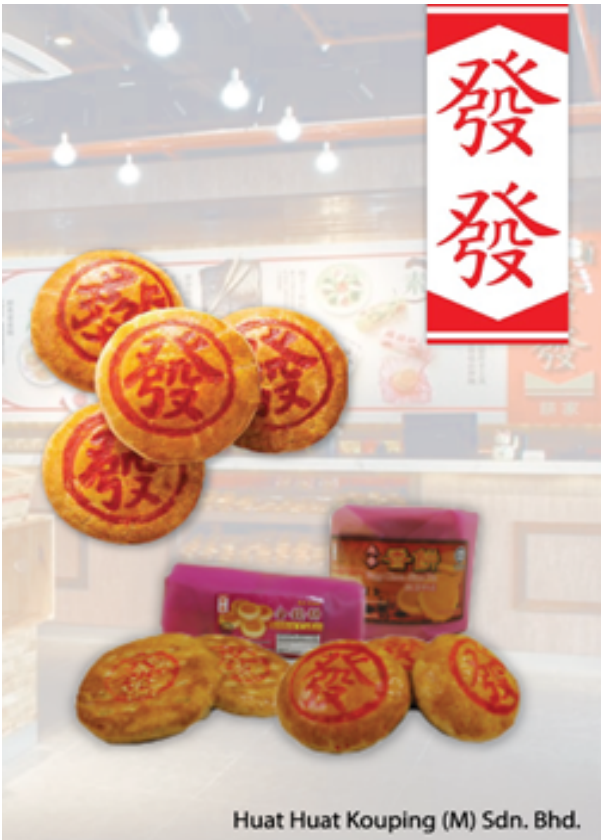
Huat Huat Kouping (M) Sdn. Bhd.