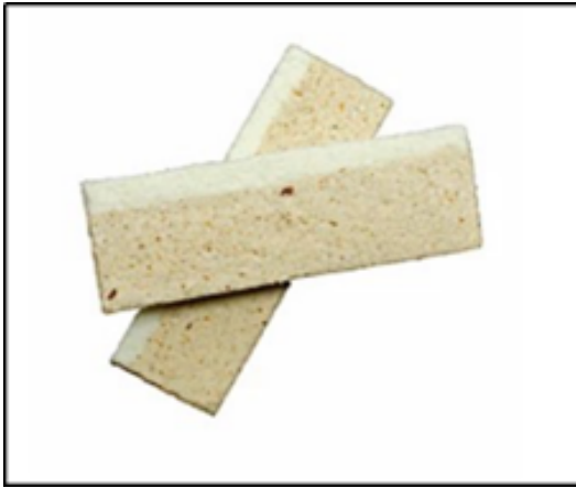
kuih lima rempah

Kuih lima rempah tradisional dibuat dengan menggunakan tepung kek, gula dan serbuk lima rempah. Kuih ini adalah tukang tangan tradisional dan hanya didapati di syarikat Huat Huat Kouping (M) Sdn.Bhd. Oleh sebab itu, kuih lima rempah juga merupakan sejenis produk makanan yang khas dan sedap di daerah Muar. Ramai pelanggan akan melawat ke Huat Huat Kouping (M) Sdn. Bhd untuk membeli produk ini.