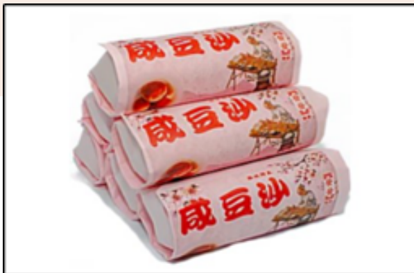
Bungkusan Tau Shar Piah (masin)