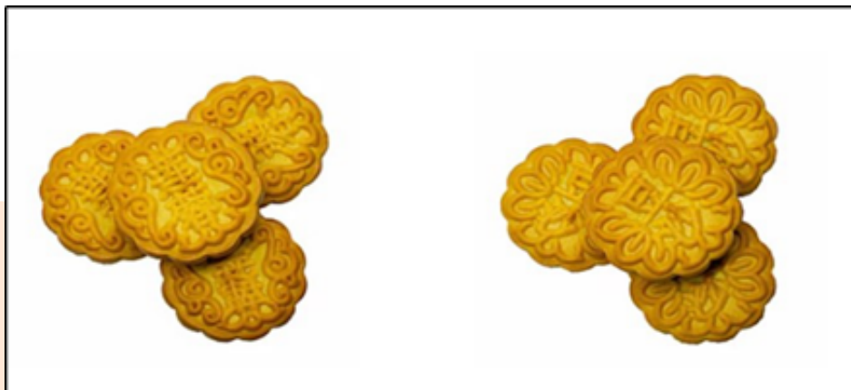
KUIH BULAN BIJI TERATAI

Kuih lima rempah tradisional dibuat dengan menggunakan tepung kek, gula dan serbuk lima rempah. Kuih ini adalah tukang tangan tradisional dan hanya didapati di syarikat Huat Huat Kouping (M) Sdn.Bhd. Oleh sebab itu, kuih lima rempah juga merupakan sejenis produk makanan yang khas dan sedap di daerah Muar. Ramai pelanggan akan melawat ke Huat Huat Kouping (M) Sdn. Bhd untuk membeli produk ini.