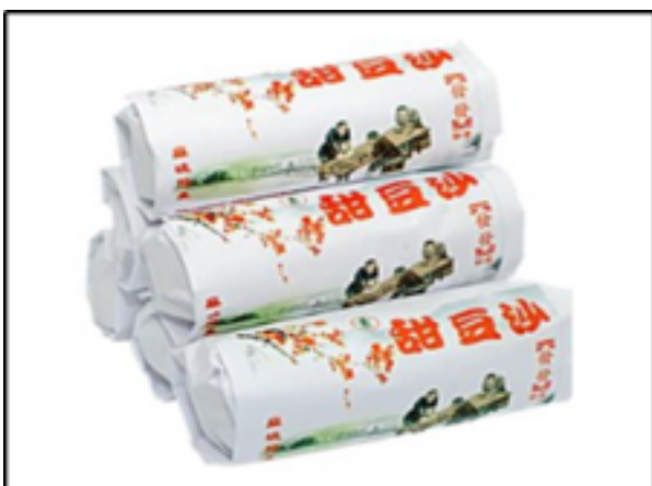
Bungkusan Tau Shar Piah (manis)

Bungkusan Tau Shar Piah tetap mengekalkan cara tradisional bungkusan di daerah Muar dan merupakan suatu bungkusan yang diturunkan pada awal tahun sehingga sekarang. Oleh itu, bungkusan tradisional biskut Huat Huat Kouping (M) Sdn Bhd mempunyai nilai yang tinggi dan dapat diingat oleh pelanggan selepas membelinya.