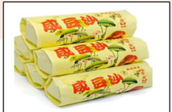
Bungkusan Tau Shar Piah (masin dan vegetarian)