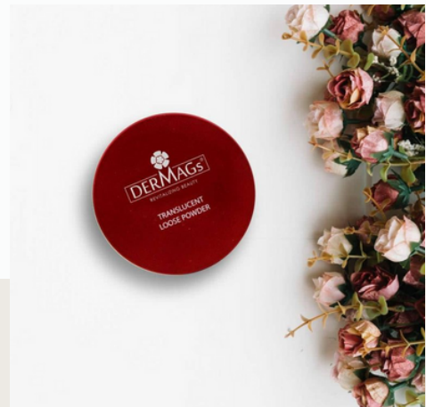
Translucent Loose Powder