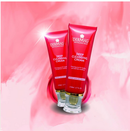
Deep Cleansing Cream