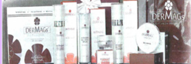
PENCUCI pencerah intensif, penyegar intensif, serum pencerah intensif dan krim pencerah intensif antara keluaran DERMAGS.