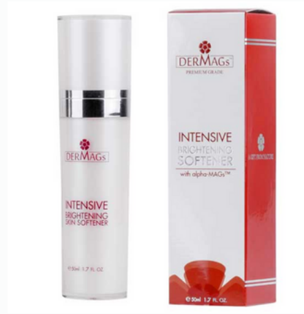
Intensive Brightening Softener (50ml)