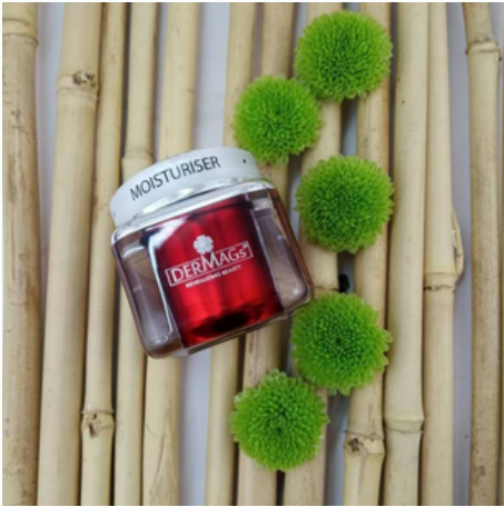
Hydrating Moisturiser (30g)