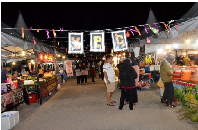
Gambar gerai jualan di Tapak CCSL.