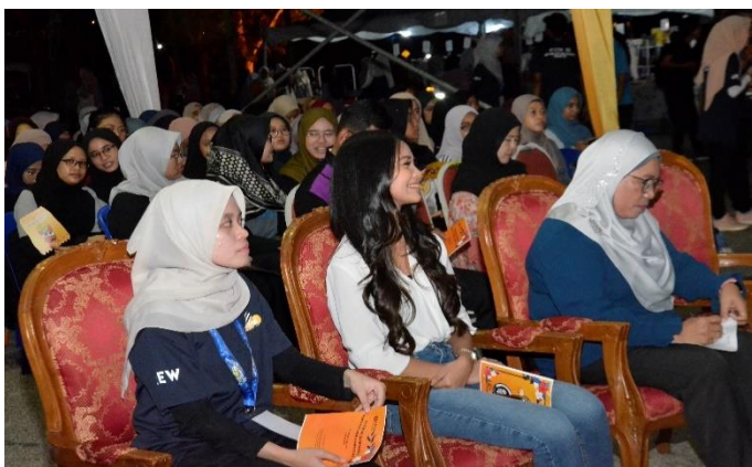
Majlis perasmian dan Beauty Talk.