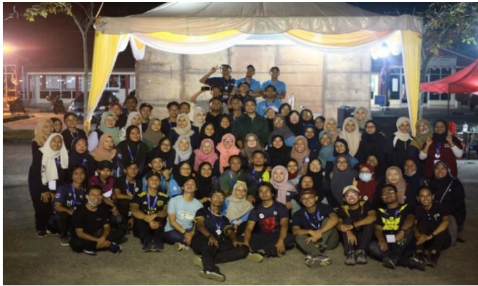
Barisan Ahli Jawatankuasa YPC 2020