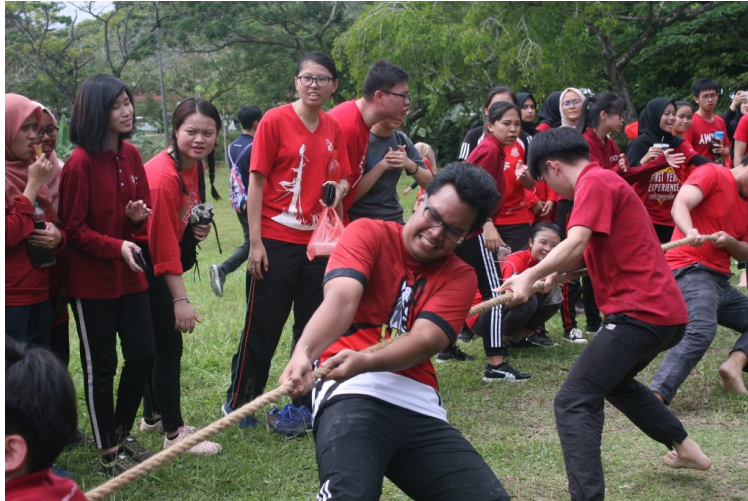
Acara tarik tali kategori lelaki.