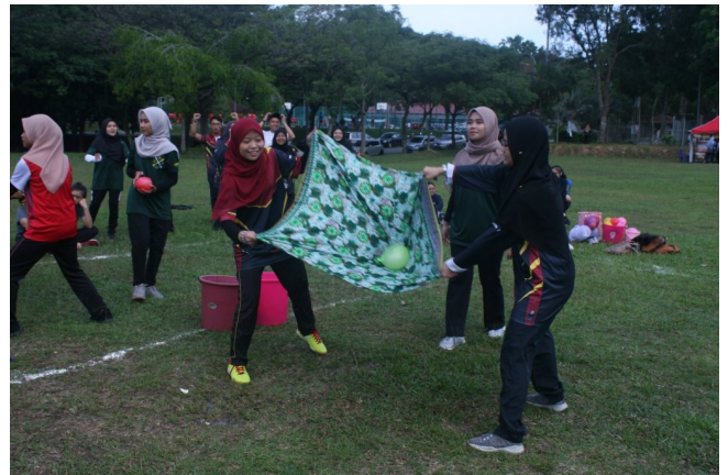
Belon batik perempuan