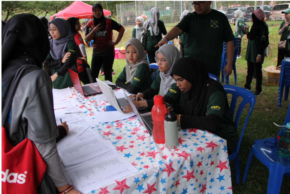
Sesi pendaftaran pelajar tahun satu Fakulti Sains