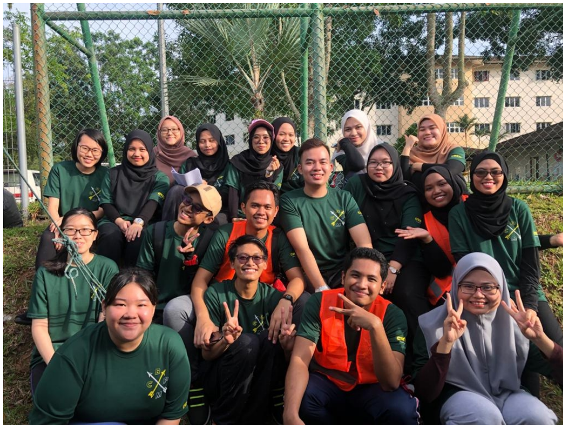
Gambar kenangan bersama-sama rakan sekelas yang turut menjadi sebahagian daripada ahli jawatankuasa SUKFAS 2019.