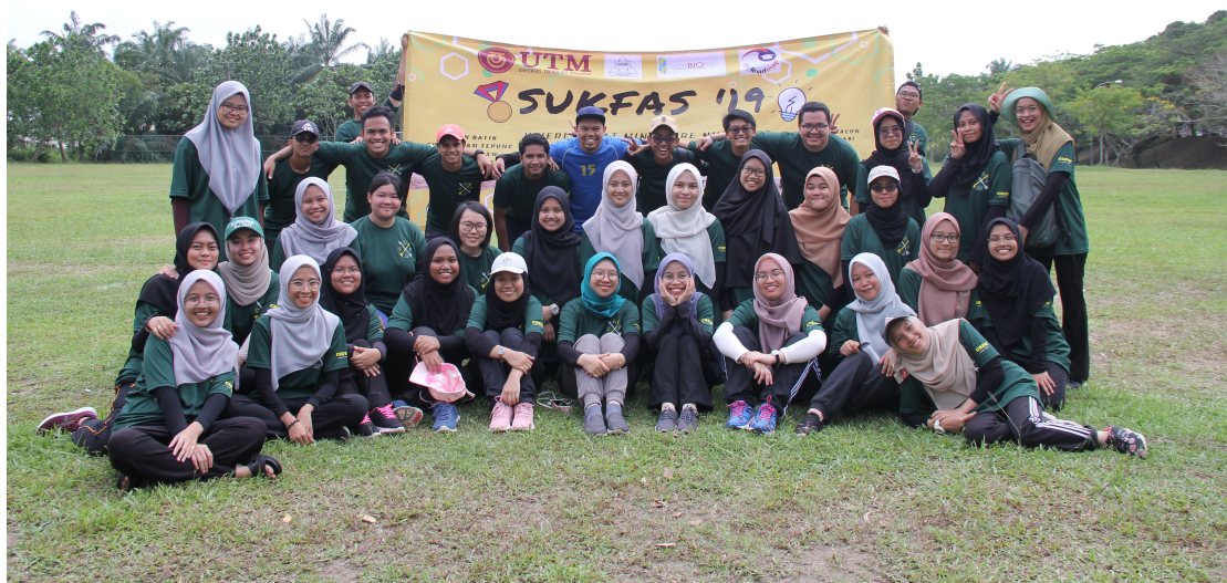
Gambar bersama semua ahli jawatankuasa SUKFAS 2019 dan penasihat program.