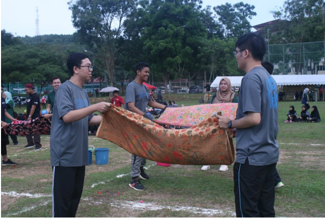
Belon batik lelaki