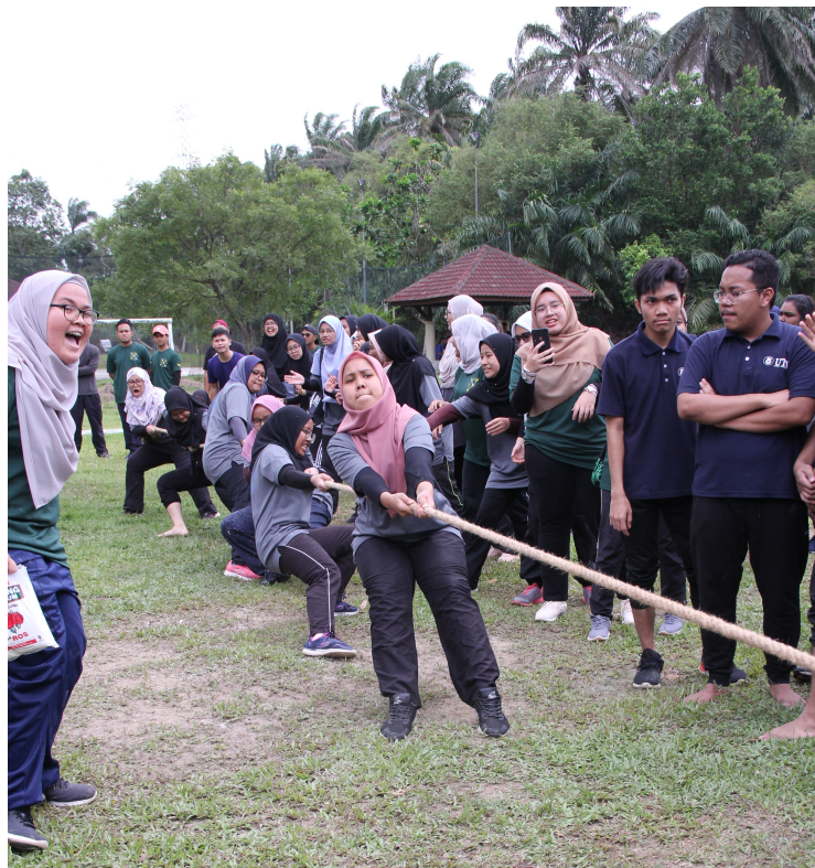
Acara tarik tali kategori perempuan.