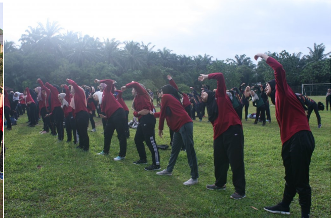
Senamrobik atau 'Zumba' sebagai aktiviti pemanasan badan sebelum memulakan acara sukan dan permainan.